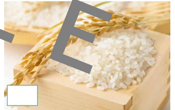
おいしいお米 30キロ