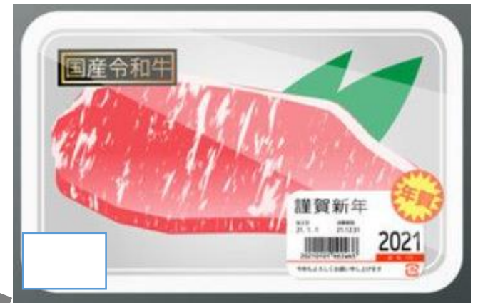
最高級和牛 5 パック